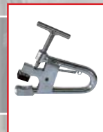
G90A6 ALU RIM CLAMP