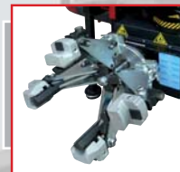
G108A1 ALU PROTECTION (4 x kit)