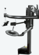
HP2 - 93Y005000 x 1