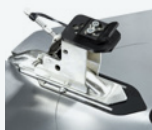
SMA - 93Y005101 x 1