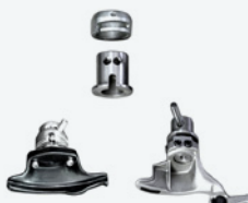
KCR - 93Y005050 x 1