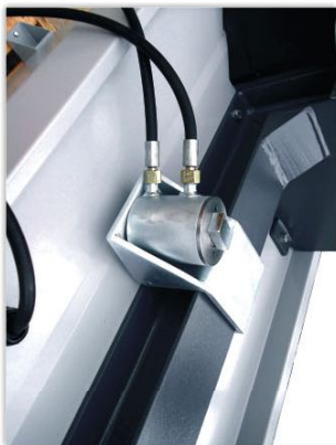
Taşınabilir Hidrolik Piston

Hitec 30 jant Düzeltme Makşnası ve Torna Ekipmanı 10"-30" ölçülerindeki alüminyum alaşımli ve demir jantların düzeltilebilmesi için tasarlanmştır. Makşnanın ergonomik tasarımı sayesinde tüm servis teknisyenlerince kullanılabilmektedir. Taşınabilir hidrolik piston ile hasarlı jantlardaki tüm eğrişmiş bölgeler sadece birkaç dakikalık kısa bir operasyon ile kolaylıkla düzeltilebilmektedir.