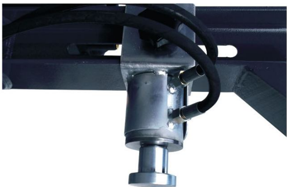
Yatay Piston Yatađı

Hitec 30 jant Düzeltme Makşnası ve Torna Ekipmanı 10"-30" ölçülerindeki alüminyum alaşımli ve demir jantların düzeltilebilmesi için tasarlanmştır. Makşnanın ergonomik tasarımı sayesinde tüm servis teknisyenlerince kullanılabilmektedir. Taşınabilir hidrolik piston ile hasarlı jantlardaki tüm eğrişmiş bölgeler sadece birkaç dakikalık kısa bir operasyon ile kolaylıkla düzeltilebilmektedir.