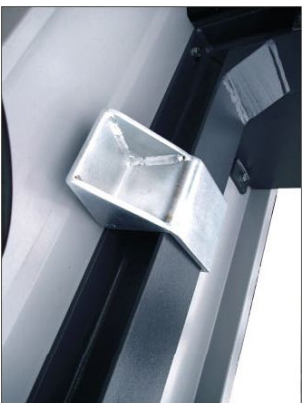
Dikey Piston Yatađı